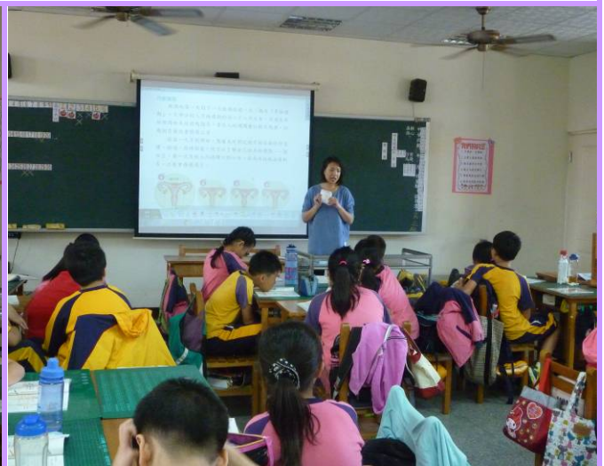
校護進到班級對學生講解月經週期發下「小女孩的大秘密」讓學生瞭解