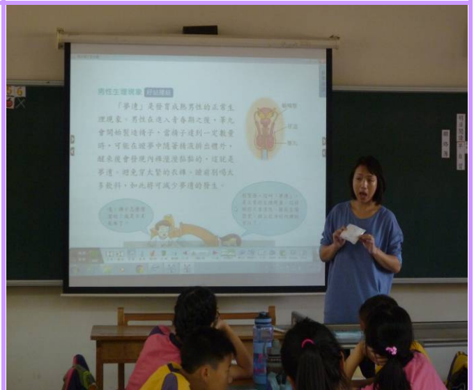
透過課程讓學生瞭解自己身體變化 說明衛生棉的種類及正確使用方式